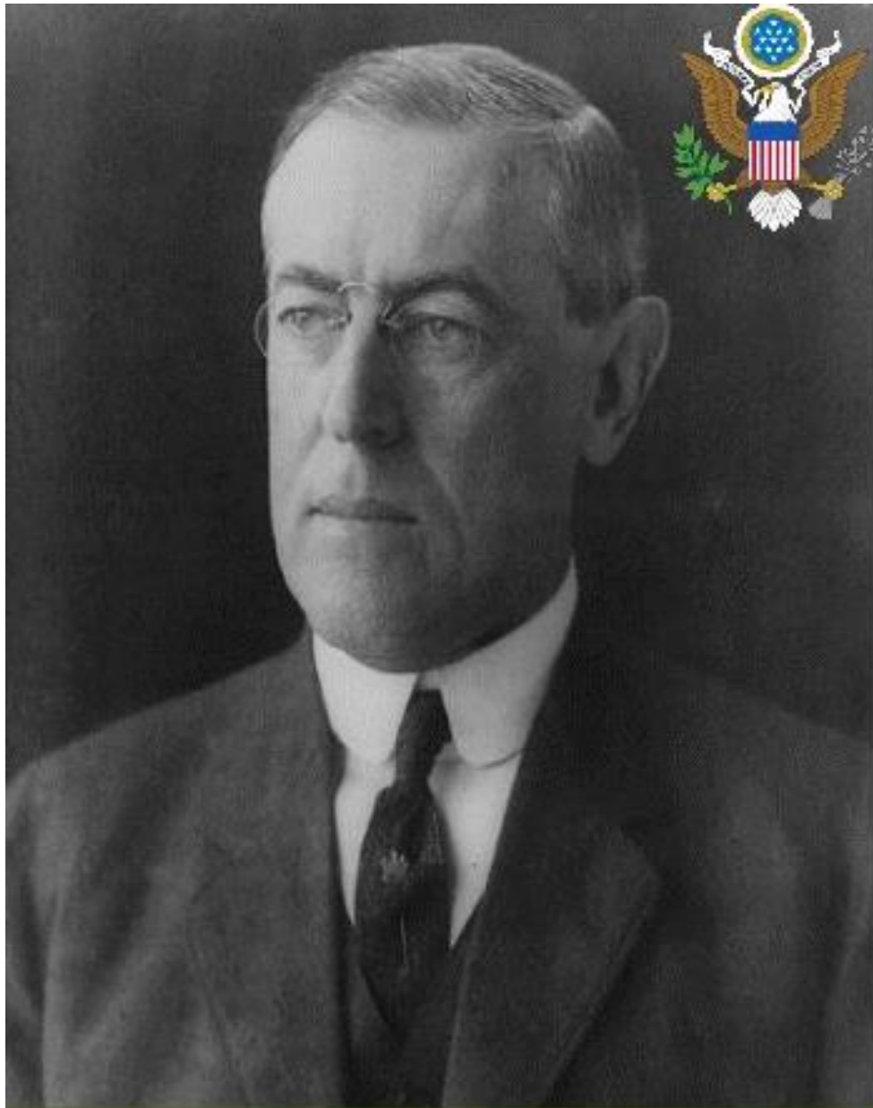
Thomas W. Wilson. Presidente de EE.UU.