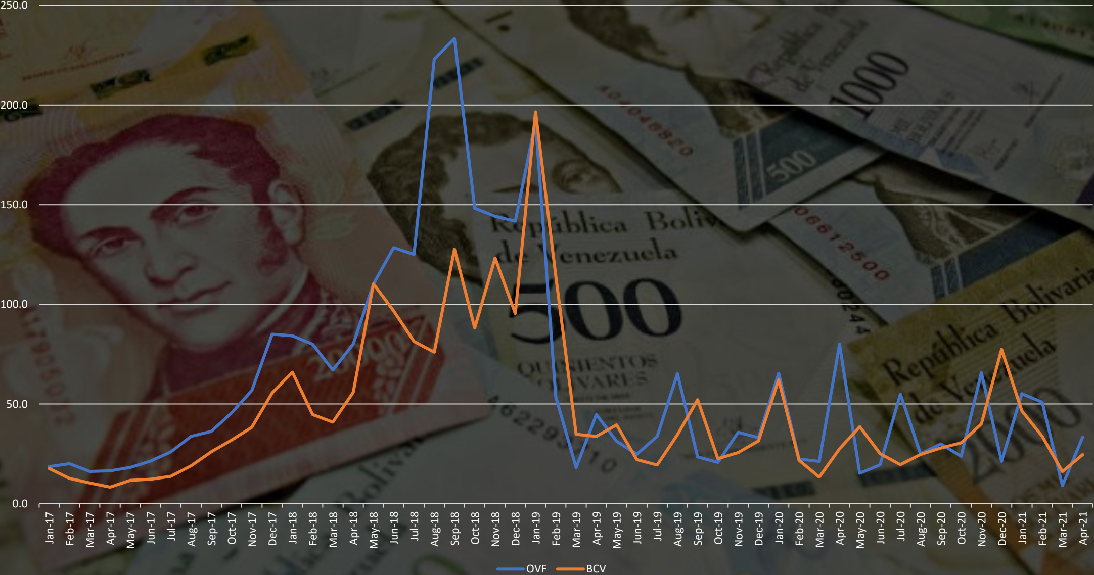
Comparación del INPC OVF/ BCV